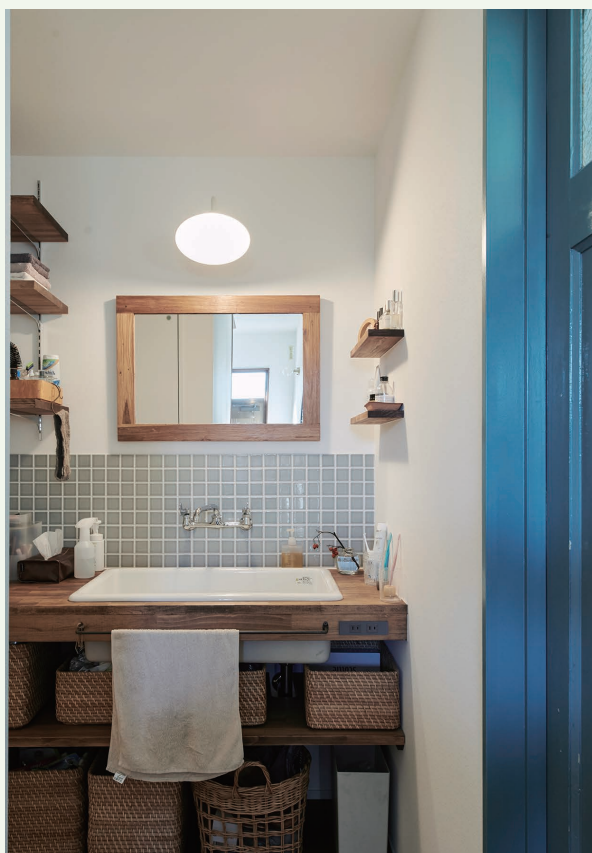
パントリーはキッチンとサウナの間生まれたスペースに。洗面台は、廊下の突き当たり生まれたスペースに。