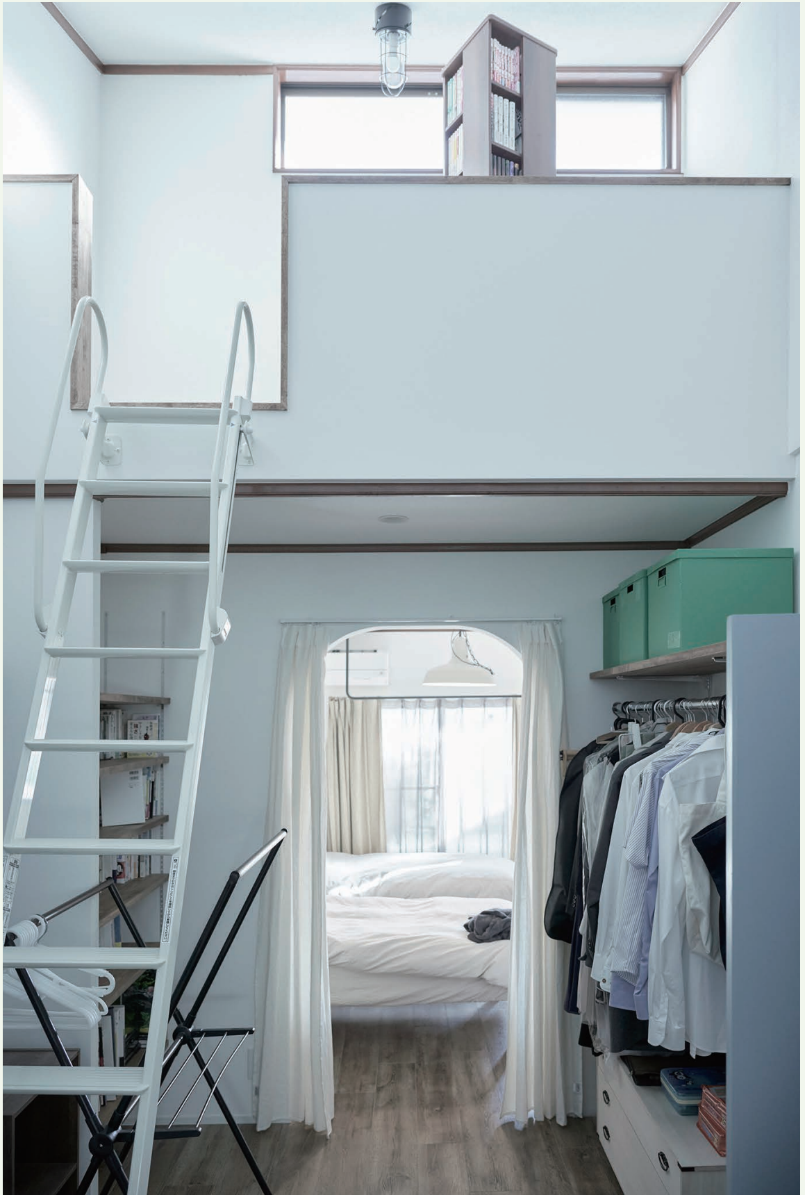
ロフト付きの洋室をウォークインクローゼットとして利用。ベッドルームから床をつなげることで、開放的な空間になりました。